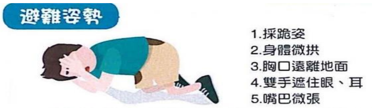
附圖：防空避難姿勢

(3)姿勢：背向窗戶或爆炸方向，盡量壓低身體，採跪或趴下姿勢，拱起身體胸口離開地面。以雙手遮住眼睛，姆指摀住耳朵，嘴巴微張如圖1（爆炸會產生強大推震力，震飛人車或造成無數飛濺破片，其次爆炸衝擊波不管有沒有牆壁等遮蔽物，都會對周遭產生瞬間壓力差，可能對人體造成耳膜破裂、眼球突出或內臟損傷等傷害）。